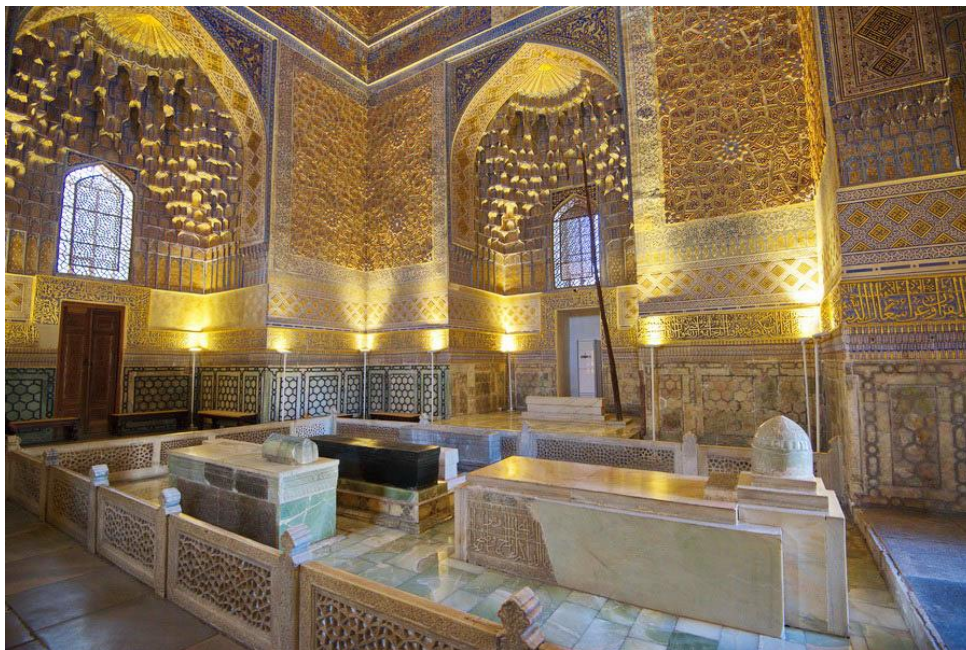
Рис.1 Внутренний интерьер мавзолея Амира Темура «Гур Эмир»

В заключении анализа первых музеев и галерей, открытых для общественного просмотра и посещения, позволило выделить ряд устойчивых приемов, основанного в начале XV века в традиции построения их пространственной структуры. Большинство зданий, построенных с начала XV века, имели в плане выдержанную композицию, продвигающую от центрального подкупольного пространства, подчеркнутую входную ось, симметричный, тяготеющий к восьмиграннику, план. Входное пространства, система движения в музее, организация экспозиционного пространства – именно через организацию трех составляющих посетитель воспринимал музейное пространство в целом. Ярким примером такого вида музея или галереи, служит мавзолей Амира Тимура «Гури Амир» в Самарканде. Интерьер которого после погребения Тимура был развешан личными вещами Амира